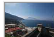
Vendesi casa da ristrutturare Acquacalda Lipari Euro 170,000.00