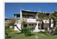
Appartamento pp residence al Porto Vulcano Euro 90,000.00