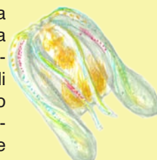
Noce di mare

La noce di mare ( Mnemiopsis leyidi ) , è un animale carnivoro estremamente invasivo che somiglia ad una medusa, capace di alterare in pochi giorni l'equilibrio di intere catene alimentari. Fu avvistata per la prima volta nel 1980 nel Mar Nero, trasportata dalle acque di zavorra delle navi. La sua massiccia proliferazione contribuì al tracollo dell'industria della pesca in quanto si nutriva voracemente di larve e uova di pesce e larve di molluschi come vongole e mitili, delle quali solitamente si nutrono acciughe e sardine. Molto adattabile, si riproduce facilmente. Recentemente segnalata nel golfo di La Spezia e nell'Adriatico, destando profonda preoccupazione. In Adriatico la proliferazione delle noci di mare verrà probabilmente frenata dal loro principale predatore, la Beroe ovata , altra specie aliena.